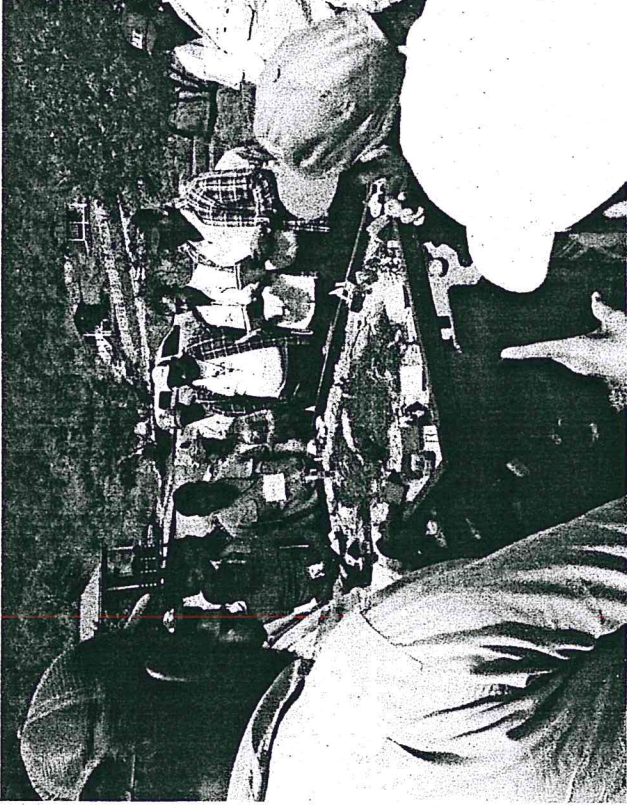
Fig.4: Curso básico de combatientes de incendios forestales

Se participó en el curso básico para combatientes de incendios forestales bajo estándares internacionales ofrecido por el servicio forestal de los Estados Unidos.